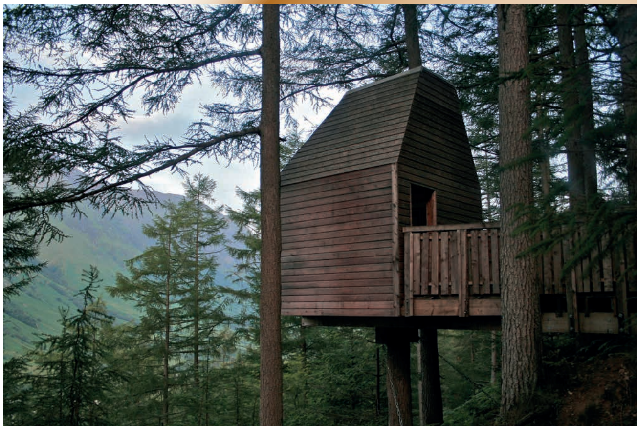
Outlandia, Glen Nevis, Scotland. London Fieldworks (Jo Joelson & Bruce Gilchrist), with Malcolm Fraser, built by Norman Clark, 2010; Outlandia is an off-grid, treehouse studio; photograph Luke Allan, 2015, courtesy Alec Finlay