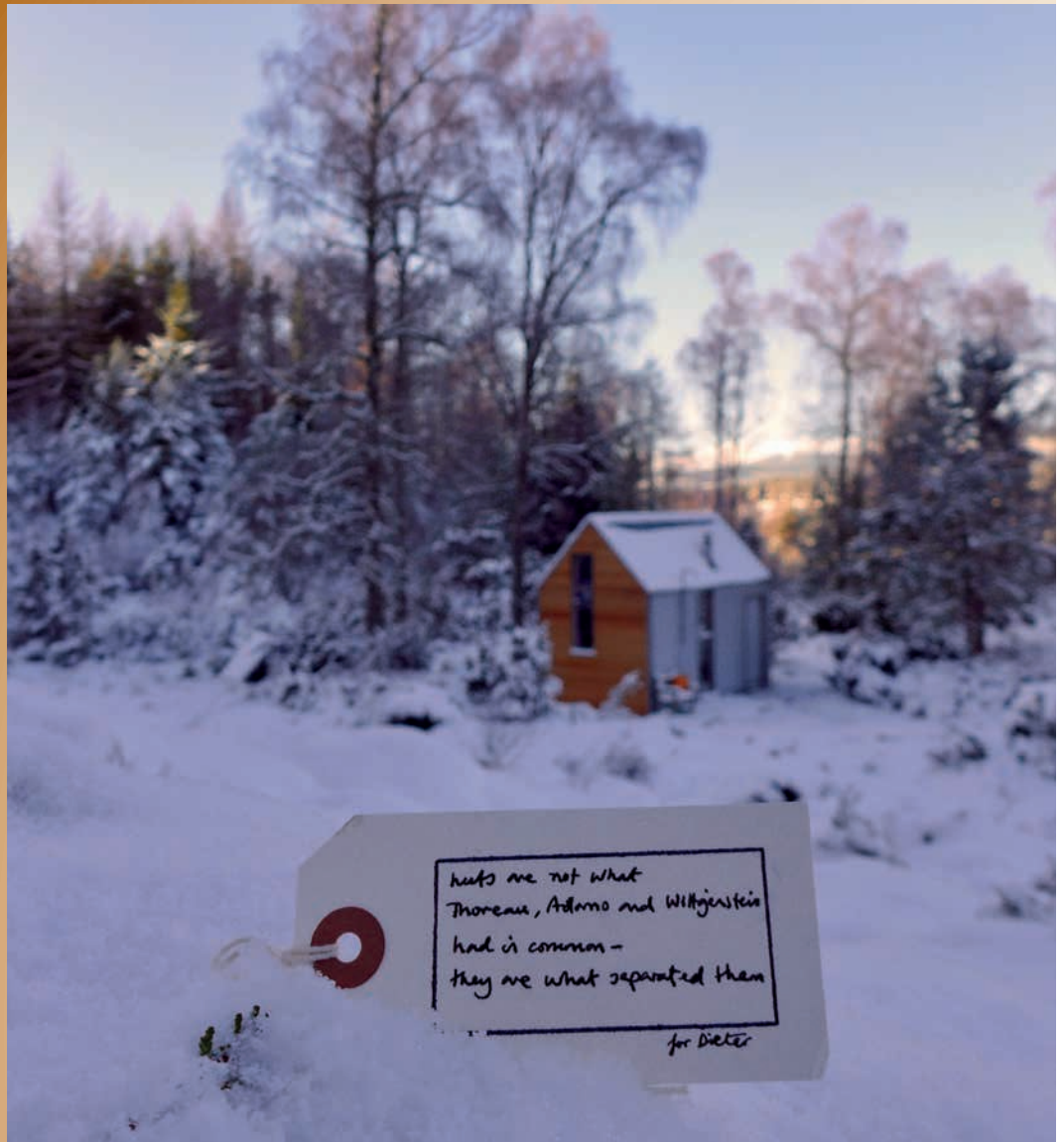
Potp-lakel, Inshriach Bothy, Alec Finlay ('huts are not what Wittgenstein, / Thoreau, Heidegger, & Adorno / have in common / but what separates them'), photograph, Alec Finlay, 2019

Bas Blaasse is schrijver, filmmaker en redacteur bij HART magazine